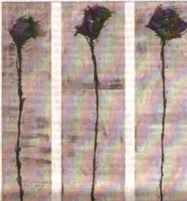
« Privilégier les lignes, même dans les natures mortes ».

« J'ai essayé dans mes élucubrations d'étudier le rapport entre le fond et la forme. Parfois je commence par un travail purement abstrait. Et il me semble bon d'y ajouter alors un portrait. Par ailleurs, j'introduis toujours toutes sortes de lignes