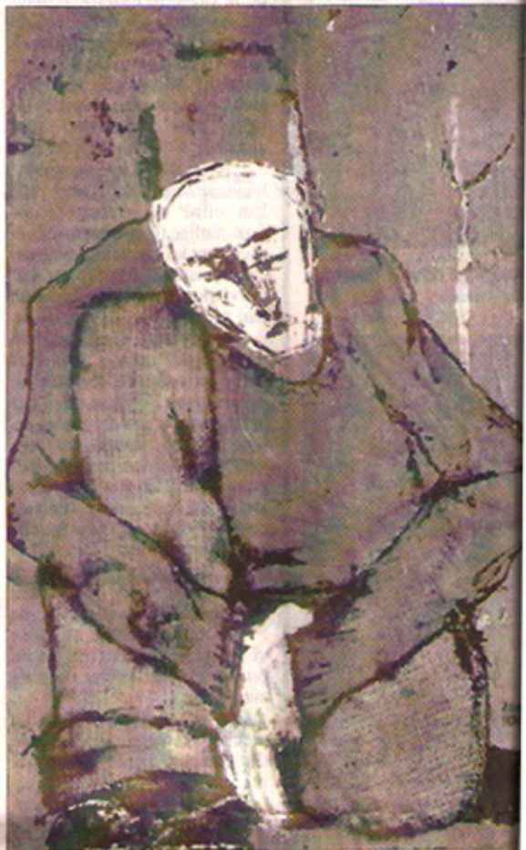
Un regard qui vagabonde et voyage.